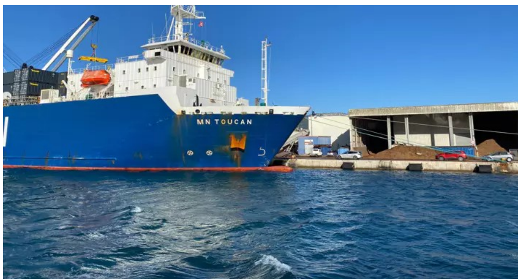
Déchargement de 200 conteneurs pour le compte de la Marine nationale.

Publié le 11/12/2023 à 09:00, mis à jour le 11/12/2023 à 09:00